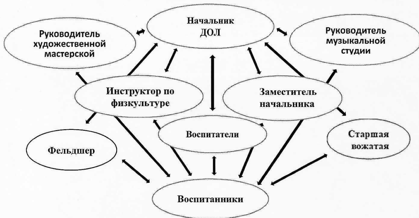
Схема управления программой